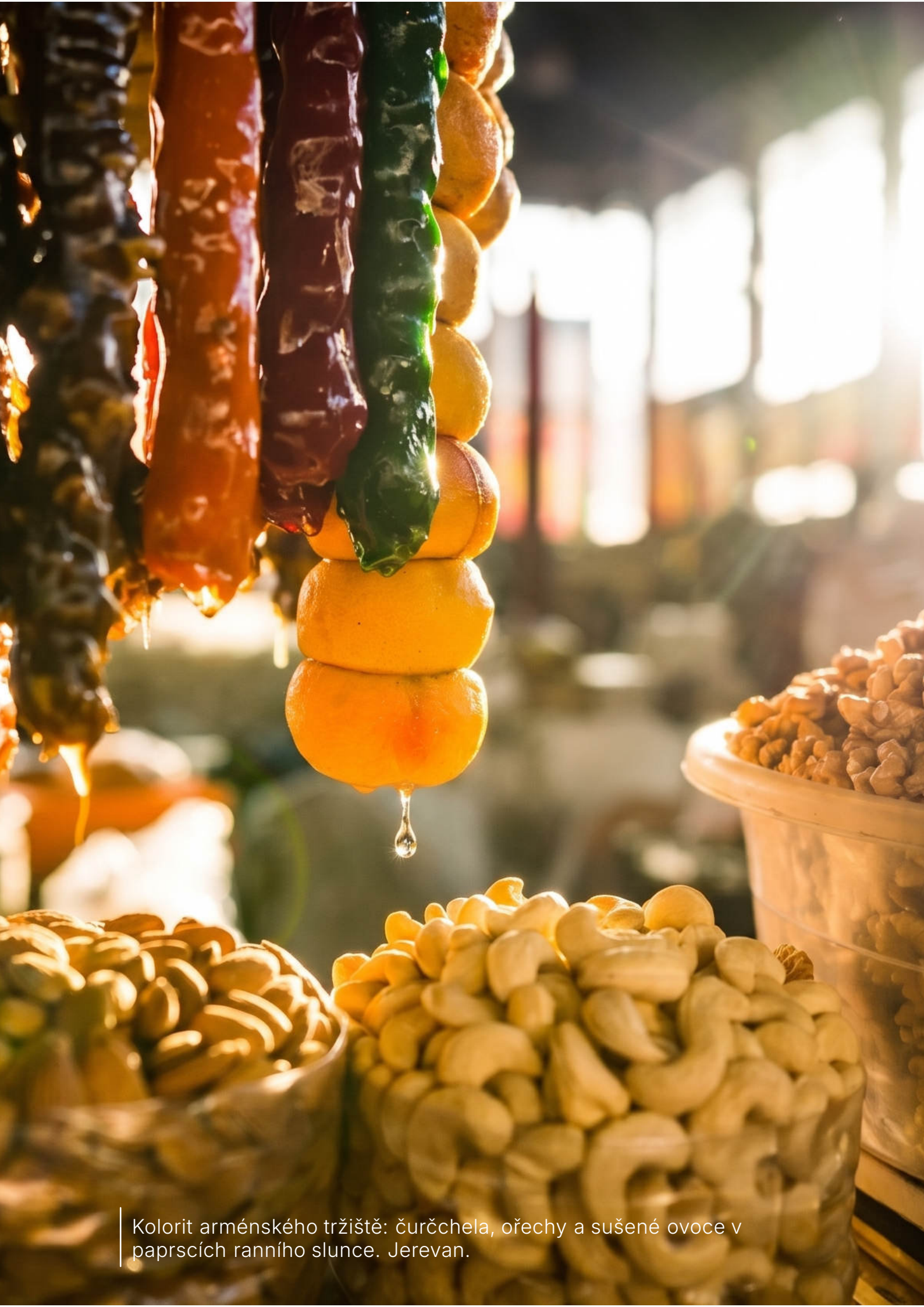
Kolorit arménskeho tržišťe: čurčchela, ořechy a sušené ovoce v paprscích ranního slunce. Jerevan.